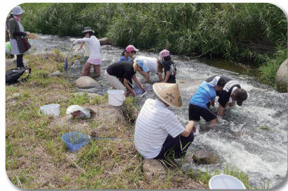
夏井川流域会のみなさん