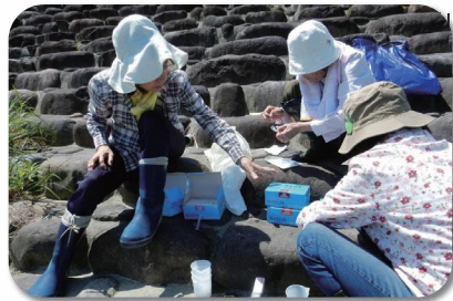
西郷くらしの会のみなさん