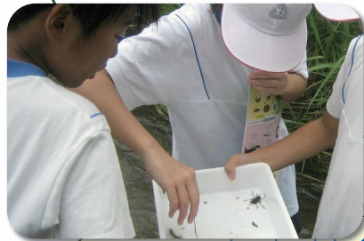
田村市立船引小学校のみなさん