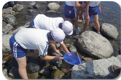
いわき市立川部小学校のみなさん