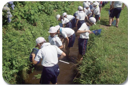
大茂田川の自然を守る会と猪苗代町立猪苗代小学校のみなさん