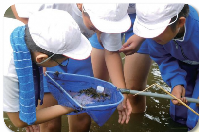
天栄村立牧本小学校のみなさん