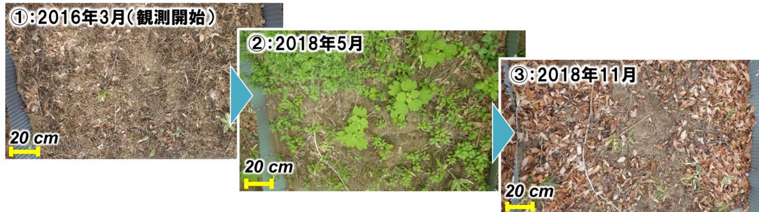
＜図1. 除染地における林床被覆率回復の様子＞

● 除染地では、林床被覆が60%程度に回復すると、未除染と同程度の流出率となった。