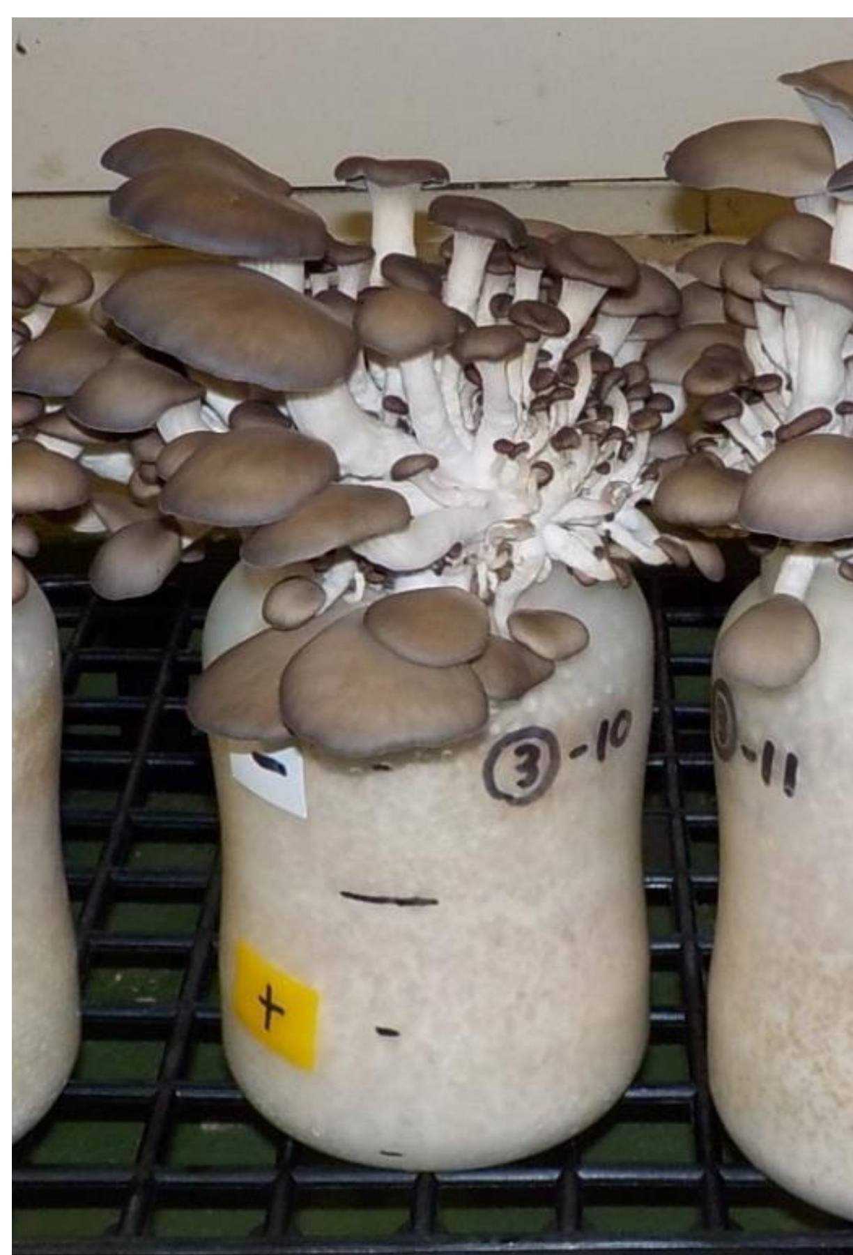
＜図3. キノコ栽培試験で培地から発生した子実体＞

キノコ（子実体）の根元近くで放射性セシウムを吸収している場合には、発生したキノコの濃度に違いが出る。以下では、木からキノコへの放射性セシウムの移行について培養試験にて調査した結果を示す。