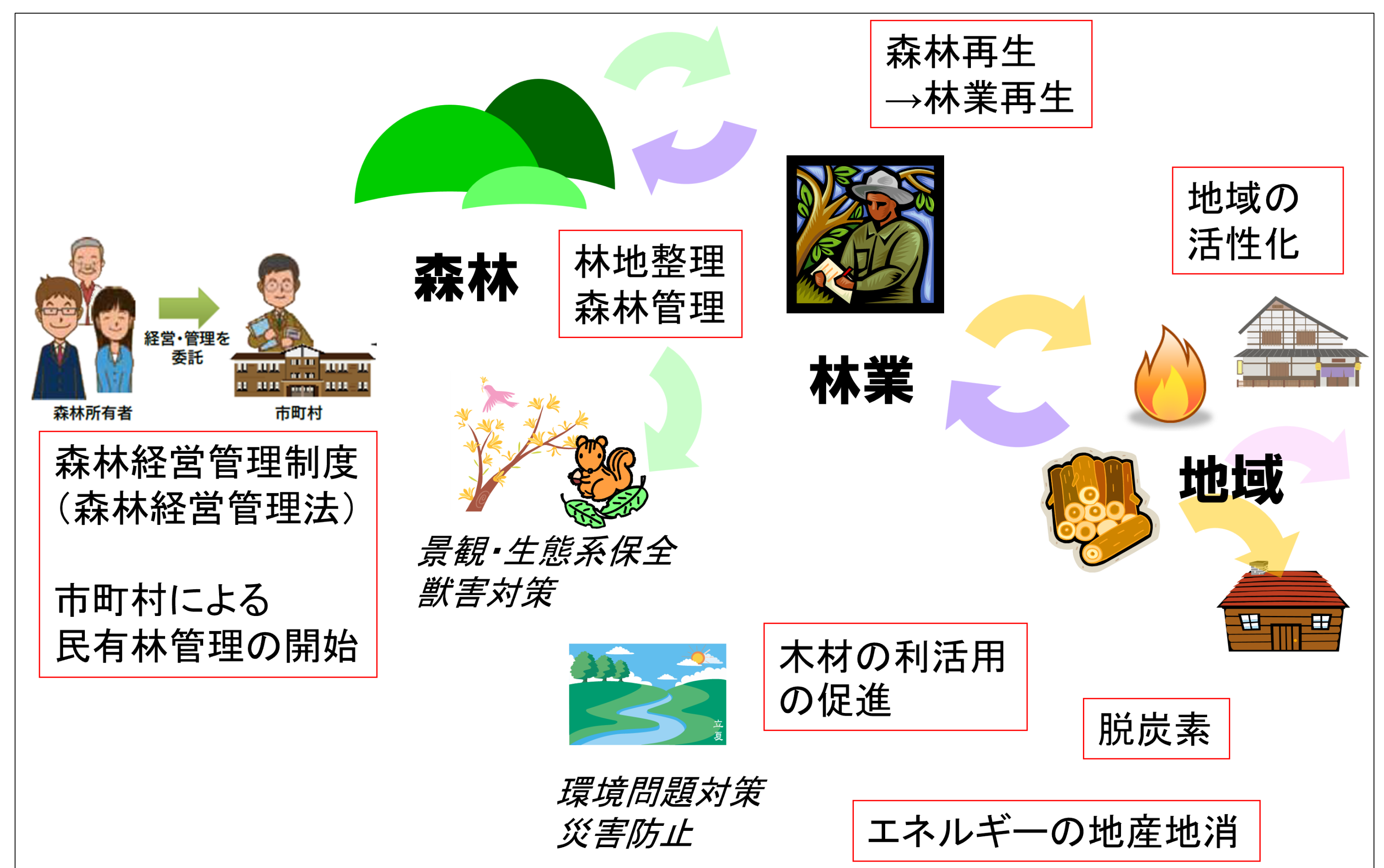
適切な森林管理の必要性イメージ

三島町では、長年の未管理により荒廃した森林の利活用が大きな課題となっており、山から材を出すきっかけづくりとしてエネルギー利用に着目し、木質バイオマスを中心とした再生可能エネルギーによる地域エネルギーシステムの検討を進め、2020年2月には町内外の関係者の協力を得て「三島町地域循環共生圏推進協議会」を設立しました（国立環境研究所はアドバイザーとして参画）。同協議会では、材の収集から燃料加工、エネルギー化、消費までの町内の各関係主体が集まり、協議が進められています。