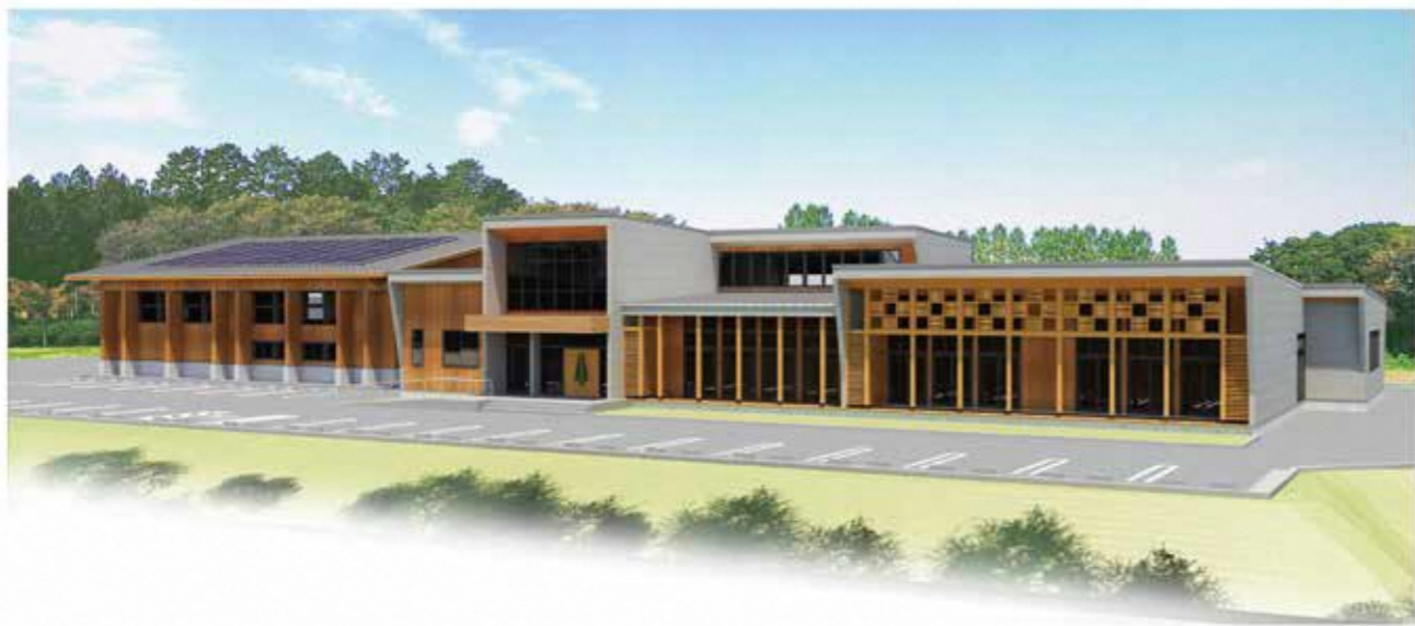
※研修施設パース(予定)