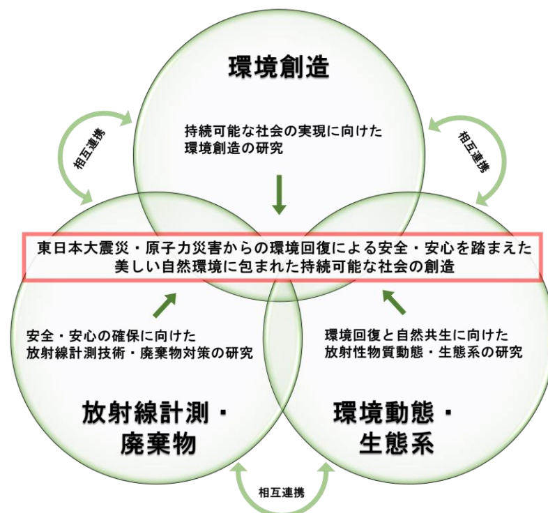
図2 調査研究事業イメージ

これらの課題等に対応するため、部門を放射線計測・廃棄物、環境動態・生態系、環境創造の3つに再編し、東日本大震災・原子力災害からの環境回復による安全・安心を踏まえた、美しい自然環境に包まれた持続可能な社会の創造に向け、調査研究に取り組む（図2 調査研究事業イメージ）。