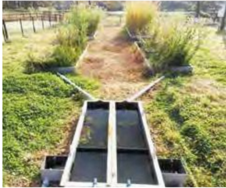
図2 人工湿地の様子