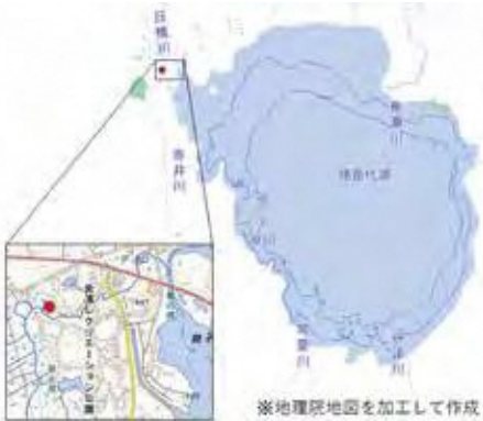
図1 人工湿地の場所

美しい猪苗代湖の環境を保全するため、湖に流入する赤井川の水をきれいにする目的で、人工の湿地を会津レクリエーション公園内に2022年に整備し※、試験を行っています。