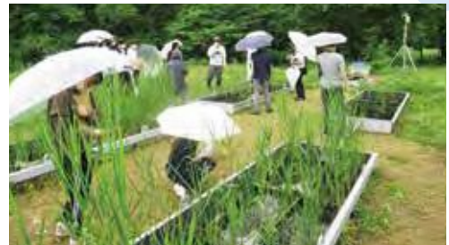
図5 高校生・大学生の見学の様子